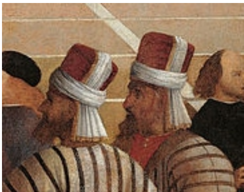
Gentile e Giovanni Bellini, San Marco predica ad Alessandria , 1504-1507