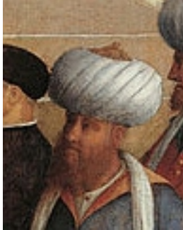
Gentile e Giovanni Bellini, San Marco predica ad Alessandria , 1504-1507