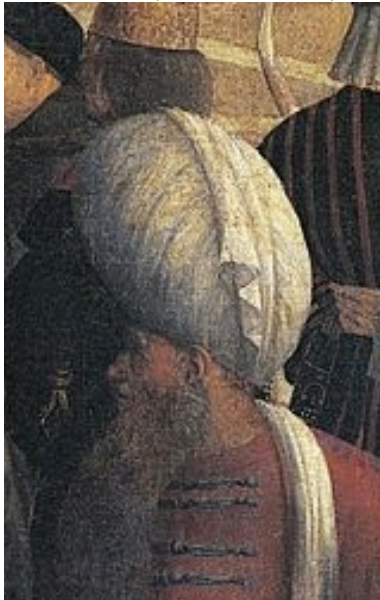
Gentile e Giovanni Bellini, San Marco predica ad Alessandria , 1504-1507