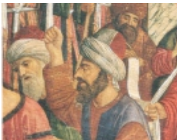
Giovanni Mansueti, L'arresto e il processo di san Marco , 1499

In origine piccolo, giallo, senza turbante, con i capelli sparsi sulle spalle. Dal 1290-93 divenne rosso e gli fu avvolto attorno il turbante. Nel 1332 venne di moda radersi i capelli e il kallawta divenne più grande.