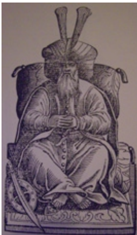
Cesare Vecellio, Qānṣaw al-Ġawrī

Dal 1501, quando salì al trono Qānṣaw al-Gawrī (1501-1516), divenne il copricapo dei sultani e dei più alti funzionari: 6 corni per il sultano; 4 corni per gli emiri da 100 uomini; 2 corni per gli emiri da 10 uomini