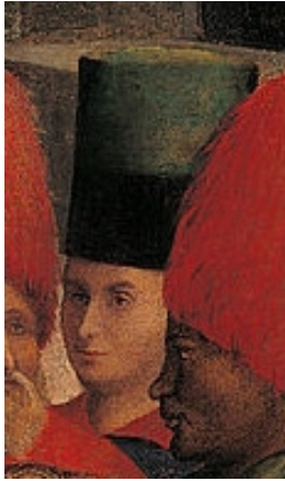
Gentile e Giovanni Bellini, San Marco predica ad Alessandria , 1504-1507

copricapo cilindrico di colori e ampiezze diverse, divenne sempre più grande e con la parte superiore a cupola (in questo caso chiamato ‘circasso’) A fine ‘400 ve ne era anche uno di due colori, verde e nero, usato dai ministri del sultano