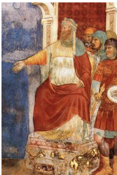
Giotto, San Francesco davanti al sultano (1295-99 circa, Assisi)