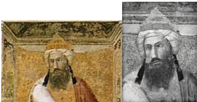
Giotto, Prova del fuoco (1325 circa, Cappella dei Bardi)

Copricapo triangolare senza fascia (turbante) attorno. Usato dai sultani ayyubidi (1174-1250) e dai mamelucchi turchi detti bahri (1250-1380 circa), abolito dai mamelucchi circassi, i burġi (1380 circa 1517).