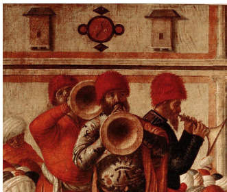
Vittore Carpaccio, San Giorgio battezza i seleniti , 1507

Abbandonato dopo la conquista ottomana del 1517 in quanto distintivo della classe spodestata (leggi dell'estate 1518 e del settembre 1521, quando si stabilì di impiccare tutti coloro che lo indossavano)