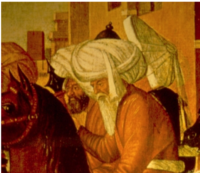
Vittore Carpaccio, Il trionfo di san Giorgio , 1502

Utilizzato dai sovrani mamelucchi quando uscivano a cavallo, coperti dal parasole. L'estremità della fascia che li formava era lasciata pendente sulla spalla sinistra ( taylasan ), e vi erano ricamati in oro i titoli del sultano. Forse si voleva ricordare che i mamelucchi, pur sovrani dell'Egitto, erano scelti tra gli schiavi. Secondo una tradizione il biblico Giuseppe portava i capelli cadenti dalla parte sinistra del volto quando era schiavo in Egitto.