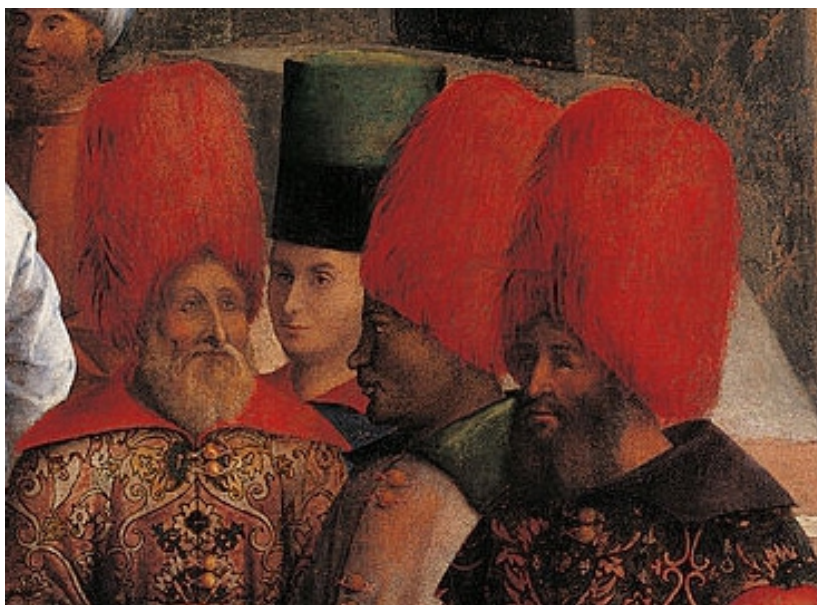
Gentile e Giovanni Bellini, San Marco predica ad Alessandria , 1504-1507