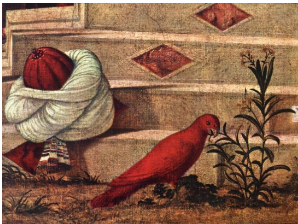
Vittore Carpaccio, San Giorgio battezza i seleniti , 1507

All'inizio del regno di Selim I (1512-1520) venne abbandonato il turbante che mostrava le estremità delle fasce.