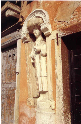
Venezia, Statua in Campo dei mori (metà '400)