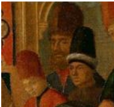
Giovanni Mansueti, San Marco risana Aniano , 1518-26 circa