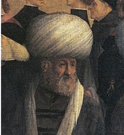
Gentile e Giovanni Bellini, San Marco predica ad Alessandria , 1504-1507

turbante grande e tondo portato dagli ulema