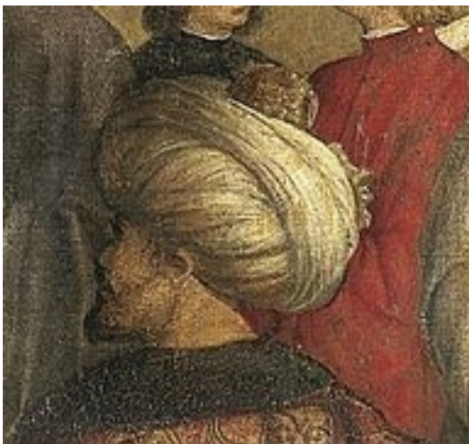
Gentile e Giovanni Bellini, San Marco predica ad Alessandria , 1504-1507

Secondo la tradizione Alaeddin, fratello di Orhan e figlio di Osman, avrebbe scelto il colore bianco per i turbanti della stirpe ottomana per distinguerli da bizantini e turcomanni. Il fez ( mücevveze ) attorno cui era arrotolato la fascia ( dülbent ) era rosso per i sovrani più antichi. Murad I (1359-1389) scelse poi il colore dell'oro nel 1371 alla presa della città di Apollonia. Mehmed II (1451-1481) tornò al colore rosso.