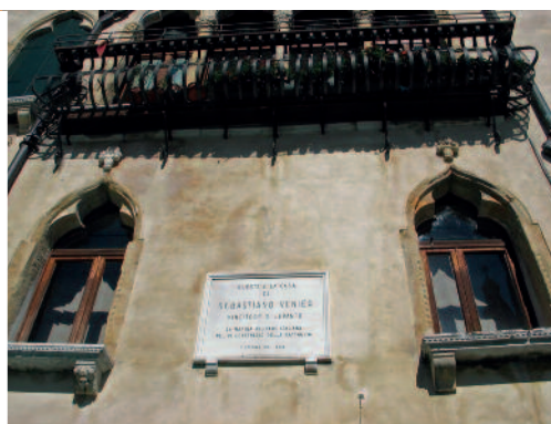
Abitazione di Sebastiano Venier, campo Santa Maria Formosa Venezia