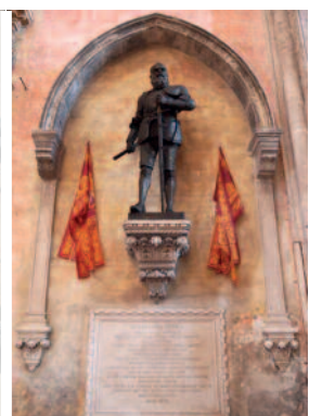
Monumento a S. Venier chiesa di Ss. Giovanni e Paolo Venezia