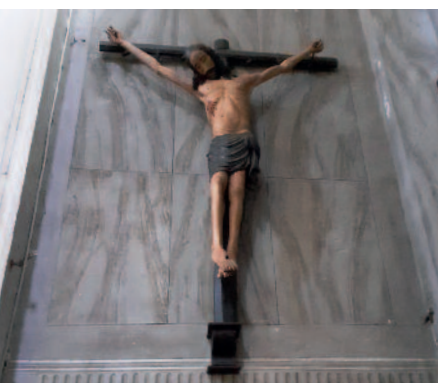
Il Crocifisso della nave ammiraglia a Lepanto chiesa di Sant'Isepo Venezia

Non sono previste tariffe di partecipazione ma offerte libere.