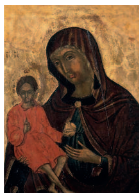
Madonna di Lepanto, icona, chiesa di S.M. Formosa Venezia